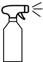
Sprayfles 500 ml Artikelnummer: HCP-40002