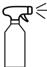
Sprayfles 1000 ml Artikelnummer: HCP-40002-1

Qlineo B.V. - Mast 38 - 3891 KG Zeewolde